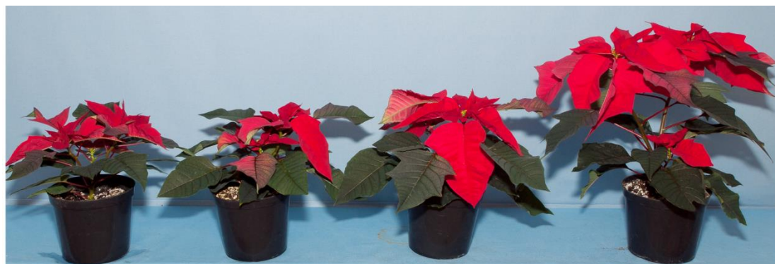
Gambar 1 Tanaman kastuba ( Euphorbia pulcherrima ) 16