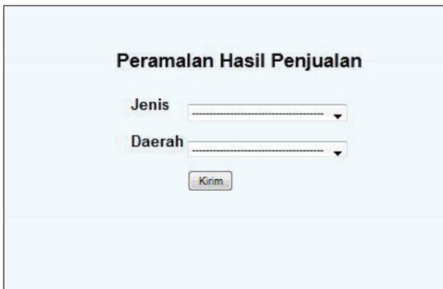
Gambar 28. Tampilan awal peramalan hasil penjualan pertanian - Dinas Pertanian Propinsi Jawa Barat

Pada Gambar 29. Tampilan hasil peramalan - Dinas Pertanian Propinsi Jawa Barat ini merupakan tampilan dari hasil peramalan yang dilakukan di wilayah Banjarnegara dengan Item cabe.