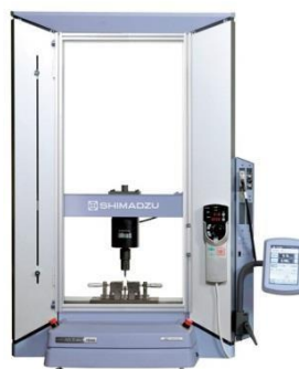
Figure 2. Shimadzu AGS-5kNx. 43

Penelitian ini menggunakan analisis statistik ANOVA one way dilanjutkan dengan metode Tukey HSD bila terdapat perbedaan.