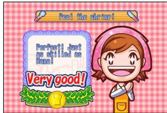
Gambar 1. Tampilan ekspresi saat pemain sukses menyelesaikan sebuah masakan