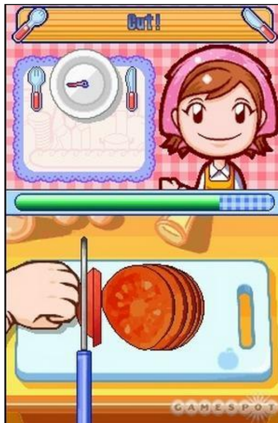
Gambar 7. Simulasi kegiatan memotong tomat

Game Cooking Mama menampilkan kegiatan memasak sebagai suatu realitas yang menyenangkan. Dalam simulasinya, kegiatan memasak dibuat sangat mudah dan sederhana sehingga menimbulkan asumsi bahwa anak-anakpun bisa memasak. Penyederhanaan bentuk, aktivitas sederhana yang dilakukan dan visualisasi grafis yang cerah merupakan sebuah abstraksi dari kenyataan memasak sesungguhnya.