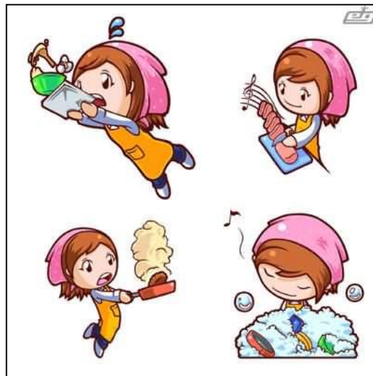
Gambar 4. Sistem gender wanita melakukan pekerjaan domestik yaitu memasak dan mencuci

(Valentine, 1999: 494). Pekerjaan 'sukarela' tersebut merupakan sebuah reproduksi makna posisi wanita yang lebih lemah dibandingkan pria (Sayer, 2005: 287).