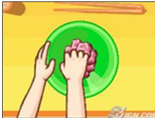
Gambar 8. Simulasi kegiatan mengolah daging

Dalam gambar 7 dan 8, pemain memotong tomat serta mengaduk bumbu dan daging menggunakan 'tangan'-nya (secara virtual). Meja, mangkuk, bahkan tangan yang menyentuh daging akan selalu tampak bersih. Jika seorang anak melakukan hal sesungguhnya, hampir dipastikan akan belepotan kemana-mana. Demikian juga dalam gambar 9, panas minyak, api dan panci penggorengan tidak akan dirasakan pemain. Hal sesungguhnya dapat membahayakan anak-anak.