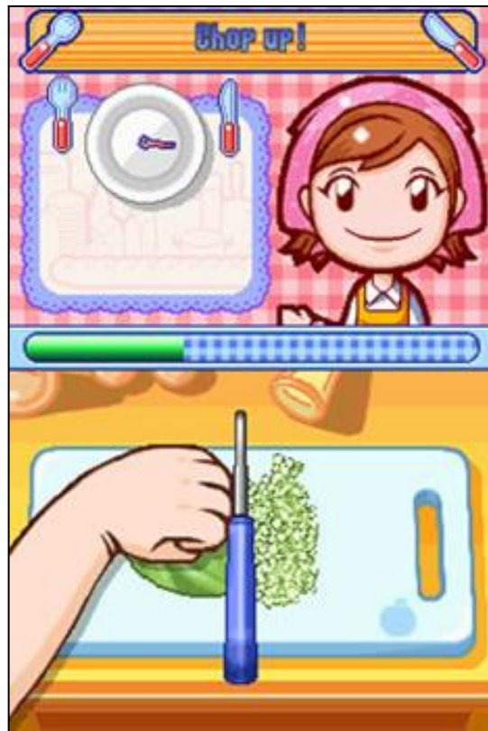
Gambar 12. Simulasi kegiatan memotong sayur dengan gerakan naik turun