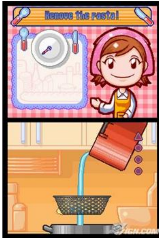
Gambar 14. Simulasi kegiatan menyirami pasta dengan gerakan memiringkan panci