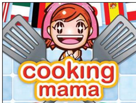
Gambar 6. Tampilan bendera dari berbagai negara pada latar belakang sampul depan game

Game Cooking Mama masih merupakan bagian dari stereotip mainan anak perempuan yang didominasi oleh boneka, putri-putri cantik, fashion (termasuk gelang, cermin, dan sebagainya) dan masak-masakan. Penggunaan warna merah muda ( pink ) masih sangat dominan sebagai stereotip warna perempuan. Walaupun pada kenyataannya anak