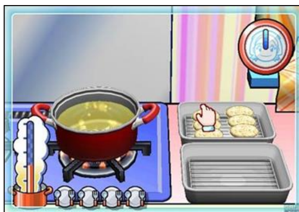
Gambar 11. Simulasi kegiatan menggoreng nuggets dalam jumlah dan penempatan yang sudah diatur

Batasan-batasan dalam game Cooking Mama bukanlah hal yang buruk, karena jika aktivitas yang dapat disimulasikan dibuat menjadi lebih nyata lagi, maka game Cooking Mama akan