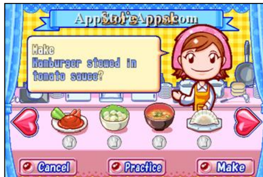
Gambar 5. Tampilan berbagai jenis masakan yang berbeda secara bersamaan di atas satu meja

Karakter Mama sendiri sebagai juru masak virtual memiliki ideologi yang mendasari tingkah lakunya. Mama seorang pencinta segala jenis masakan yang percaya bahwa masakan yang dibuat dengan baik, menggunakan bahan terbaik dan dihidangkan dengan baik akan mempersatukan keluarga/ manusia dan membuat dunia menjadi lebih menyenangkan. Hal ini terlihat melalui komentar Mama tentang masakan, variasi masakan yang berasal dari berbagai penjuru dunia, serta berbagai bendera dari negara berbeda di belakang karakter Mama pada sampul depan game .