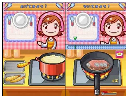
Gambar 9. Simulasi kegiatan menggoreng tempura (kiri) dan memanggang daging (kanan)

Dalam gambar 7 dan 8, pemain memotong tomat serta mengaduk bumbu dan daging menggunakan 'tangan'-nya (secara virtual). Meja, mangkuk, bahkan tangan yang menyentuh daging akan selalu tampak bersih. Jika seorang anak melakukan hal sesungguhnya, hampir dipastikan akan belepotan kemana-mana. Demikian juga dalam gambar 9, panas minyak, api dan panci penggorengan tidak akan dirasakan pemain. Hal sesungguhnya dapat membahayakan anak-anak.