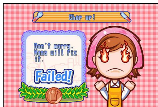
Gambar 2. Tampilan ekspresi saat pemain gagal menyelesaikan sebuah masakan