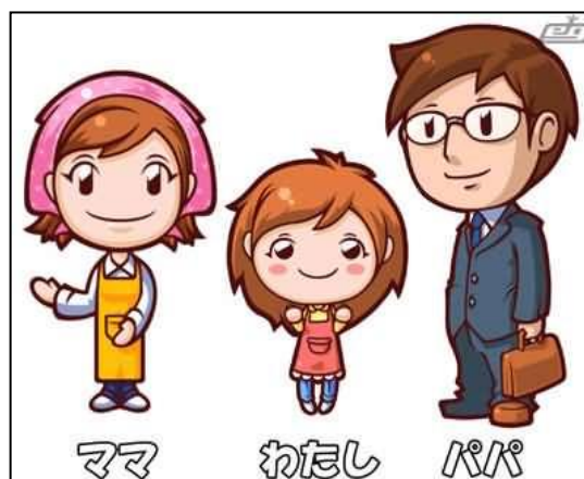
Gambar 3. Ideologi patriarch dan stereotip pembagian tanggung jawab

Dalam sistem patriarch (laki-laki sebagai pihak dominan) terdapat asumsi kuat bahwa memasak di rumah merupakan tanggung jawab pihak perempuan dan hal tersebut sudah menjadi sebuah kewajiban, bukan sebuah pilihan. Perempuan dipercaya dapat memasak lebih baik karena memiliki karakteristik lembut dan memiliki perhatian lebih. Laki-laki memiliki tugas berbeda yaitu bekerja di luar rumah mencari penghasilan untuk memenuhi kebutuhan keluarga.