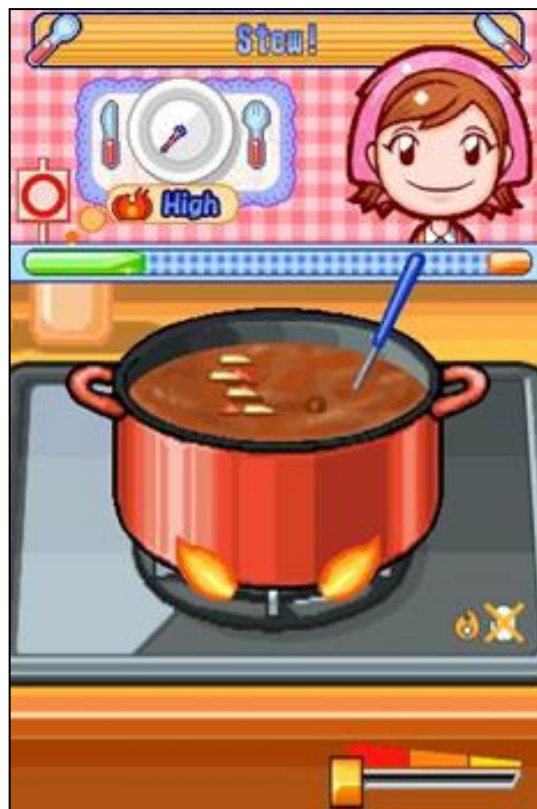
Gambar 13. Simulasi kegiatan mengaduk sup dengan gerakan berputar dan menggeser tombol suhu