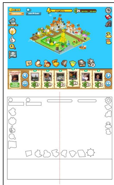
Gambar 4. Screen Capture Current Game Pirates Ahoy!

Visualisasi Screen Capture Current Game "Pirates Ahoy!" menunjukkan bahwa game ini merupakan komposisi layout yang terdiri atas tanda visual sebagai tanda utama dan tanda verbal sebagai pendukung. Secara eksplisit dapat dilihat bahwa tanda verbal adalah berupa ikon-ikon yang menunjukkan posisi dan skor pemain (posisinya pada komposisi deretan horizontal di atas).