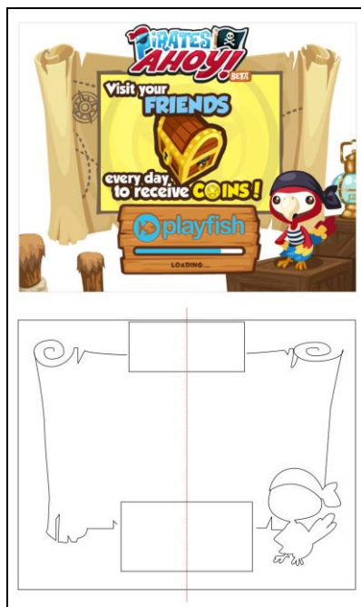
Gambar 1. Opening Scene Pirates Ahoy!

Tanda berupa indeks dilakukan terhadap freeze framing sesuai komposisi objek ter- capture serta proses loading yang sedang berjalan. Pada acuan freeze frame ini, kecuali bagian tengah kotak yang berganti-ganti setiap pemain masuk dalam game serta proses loading yang berjalan, semuanya dianalisis secara sinkronik. Sedangkan pada dua perkecualian tersebut, analisis dilakukan secara diakronik. Komposisi yang statis menunjukkan bahwa ini adalah welcoming screen yang menunjukkan adanya instruksi awal yang seyogyanya harus diperhatikan oleh pemain, dengan pemain dihibau untuk mengunjungi teman-teman sepermainan “Pirates Ahoy!” agar dapat menerima tambahan bonus, instruksi ini dapat dibaca sambil menunggu proses loading selesai. Gestur dari maskot burung beo juga menunjukkan bahwa pemain dipersilakan untuk masuk dan bersiap untuk mulai berperan sebagai bajak laut. Maskot ditampilkan tidak dalam proporsi burung sebenarnya, namun berupa komposisi deformatif yang menjadikan burung ini tampak memiliki kepala yang besar dan sifat yang cukup komunikatif. Hal tersebut terlihat dari posisi sayapnya yang ke bawah dan tidak dalam kondisi hendak menyerang atau bertahan. Melalui penggantian huruf ‘O’ menjadi koin emas juga secara indeks menunjukkan bahwa ada sebuah simbol berupa koin emas yang dapat ditambah untuk meningkatkan kemampuan setiap pemain dalam proses permainan yang berlangsung.