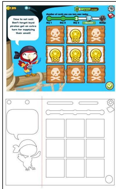
Gambar 2. First Bonus of a Day Pirates Ahoy! Sumber: dokumen Pribadi Peneliti; 2010

layar kapal, serta background biru langit. Secara keseluruhan komposisi bersifat penuh perhitungan, tidak simetris karena penempatan burung beo dilakukan secara perhitungan pembagian tiga, sama seperti komposisi pada kesembilan papan yang ada.