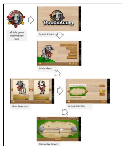
Gambar 3: Cuplikan gambar dari implementasi game dengan konten visual SKDG pada alur utama game two players dengan sebuah device yang sama

Mobile game “Dodombaan” diwujudkan pada platform Android minimal versi 2.3 dengan kemampuan layar sentuh pada device . Hasil game dapat di- download pada Google Play ( https://play.google.com/store/apps/details?id=com.ralibi."Dodombaan"_rc ).